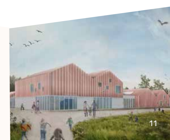
Toekomstbeeld nieuwe school

TEKST Hans Selderslaghs