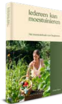
Iedereen kan moestuinieren Sofie Maes Pelckmans Uitgevers – €27 www.demoestuinvansofie.com

5. Speel en experimenteer in jouw moestuin. Geef jezelf alle vrijheid om te planten wat jij wil eten of uitdelen. Als je geen tomaten lust, hoef je geen tomaten te kweken.