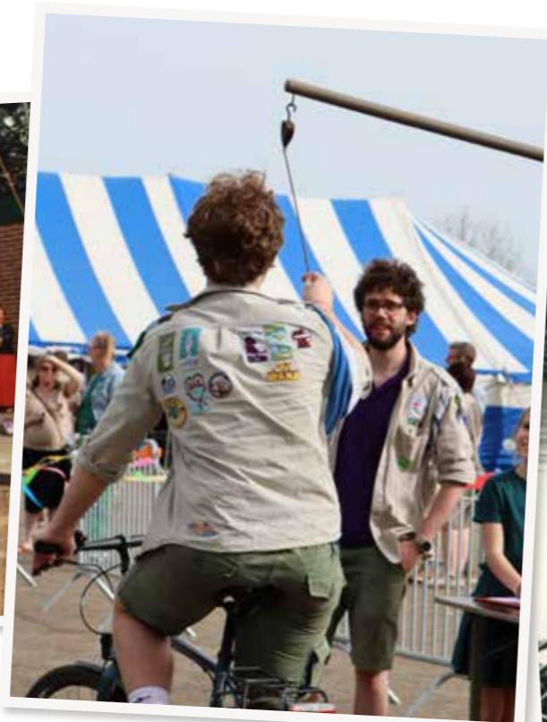
Ringsteken tijdens het feestweekend op 5 en 6 april 2024