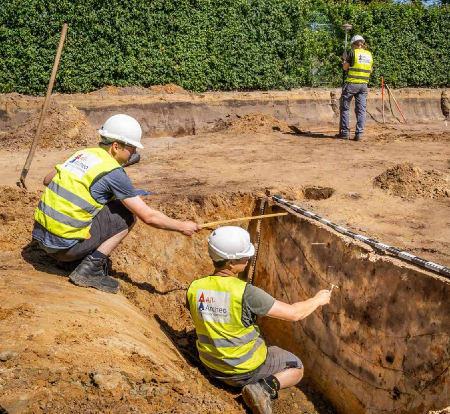
Archeologen aan het werk op de site Goezol Klokkenlaan