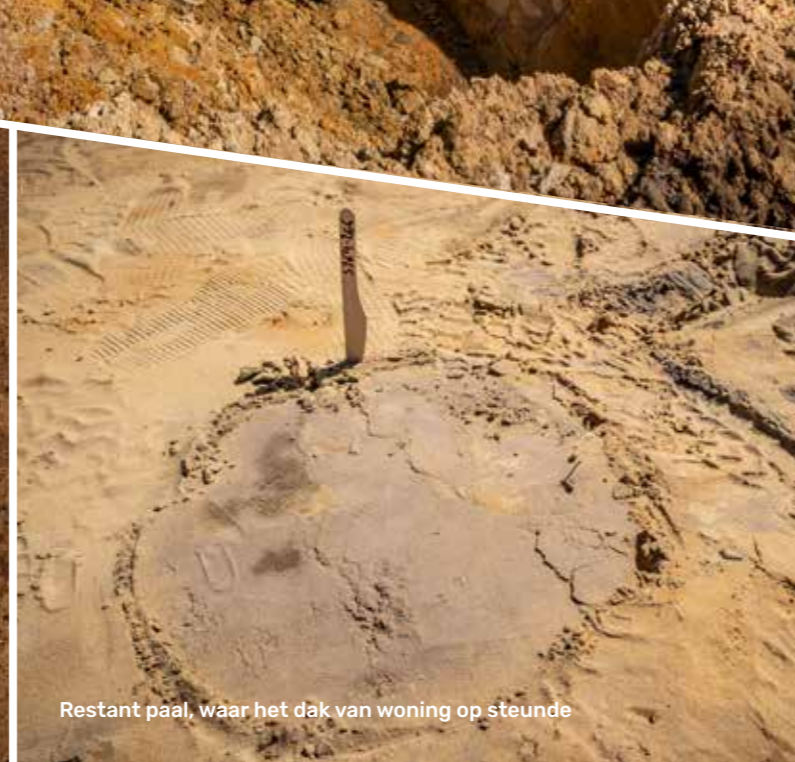
Restant paal, waar het dak van woning op steunde

Vondstkaartje Code project: 2024027 Vondstnr.: 17 Datum: 11/06/2024 Naam: 140 Werkput: 2 Vlaknr.: 1 Vak-/sectornr.: Verzamelwijze: 0491 Inhoud/opm.: M1-V1 Spoornr.: 39 Laagnr.: Muurnr.: Profielnr.: Maasw. (mm):