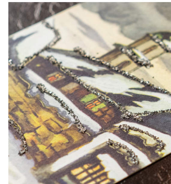
Fijne glasschilfers, de glitter van weleer.

"Op mijn favoriete kaart zie je een jongen en een meisje die een enorme bos bloemen vasthouden. Deze kaart is verstuurd in 1900. Ik vond deze kaart zo mooi dat ik haar enkele jaren geleden heb laten reproduceren en er zelf een kerstkaart van heb gemaakt om naar vrienden en familie te sturen. Ze is prachtig en vaak veel mooier dan wat je tegenwoordig in winkels kunt vinden."