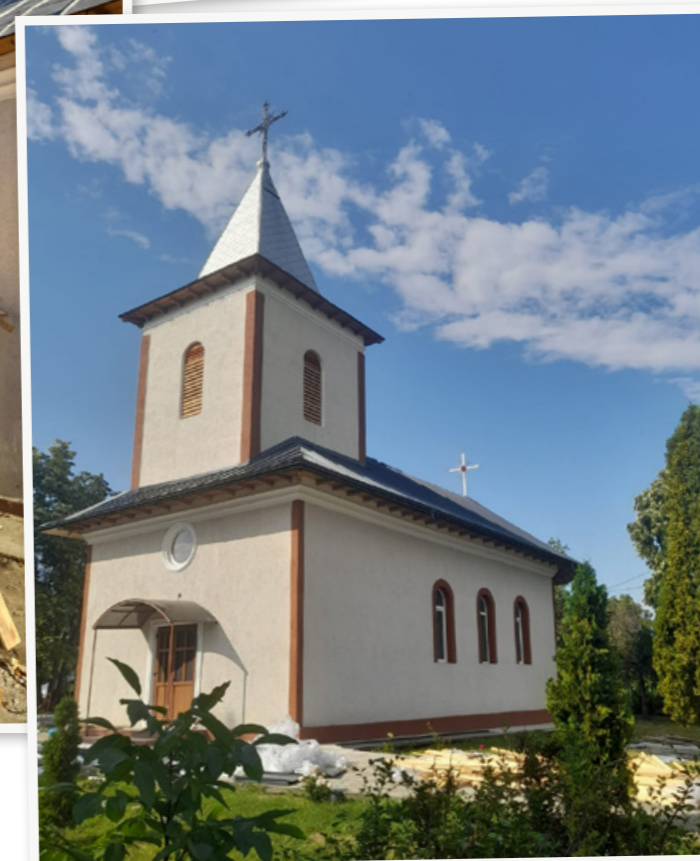
Het afgelopen jaar zorgde de vzw Nijlen voor Hodora voor de renovatie van de katholieke kerk in Iosupeni.