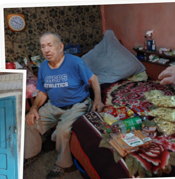
TEKST Cindy Beelen