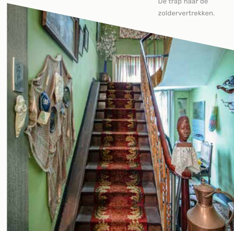
De trap naar de zoldervertrekken.