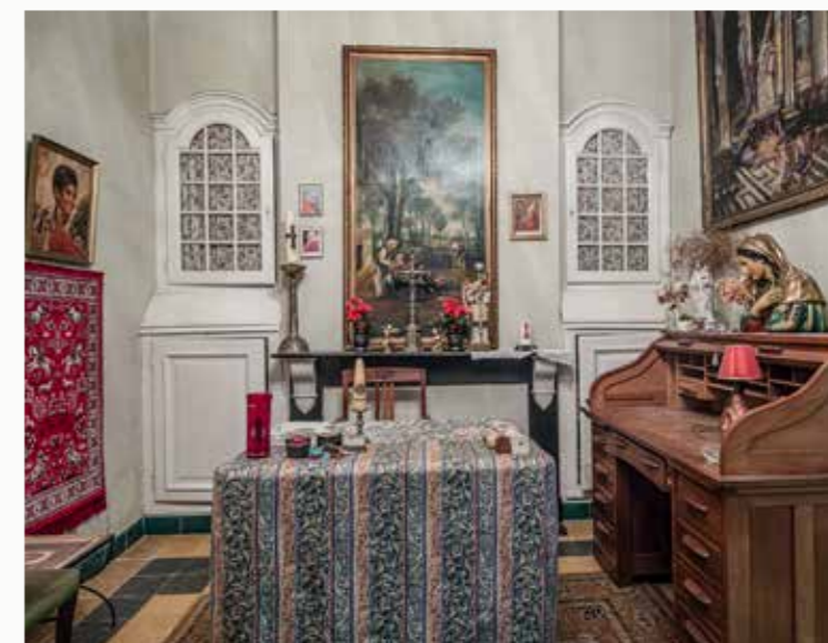
In deze kamer op het gelijkvloers werd in 1842 pastoor De Groof brutaal aangevallen.