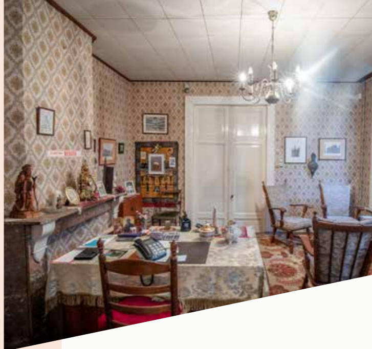
Studeerkamer, met een leuke sticker boven de schouwmantel 'Ik hou van mensen'.