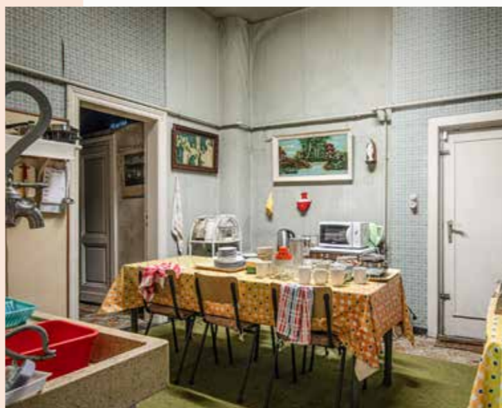
De keuken, later bijgebouwd met authentieke gootsteen.