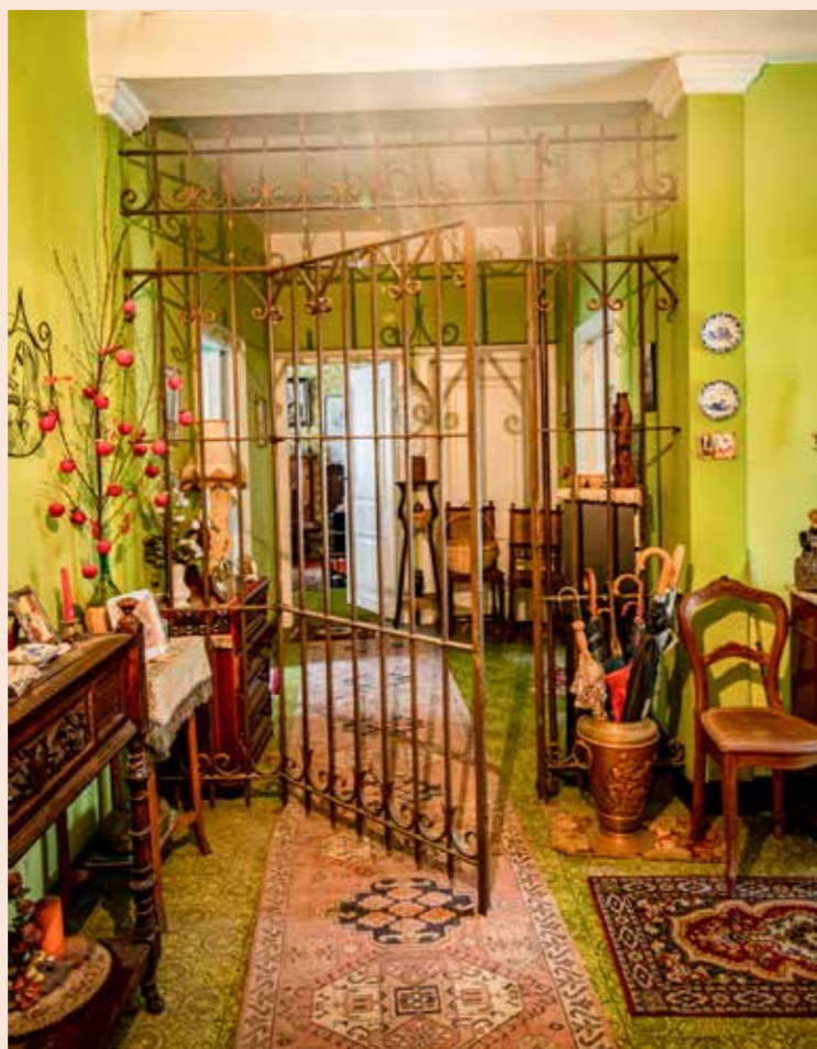
Pastoor Ceulemans liet destijds, naast een klok, ook een hekwerk aanbrengen om zich te beschermen tegen mogelijke indringers.